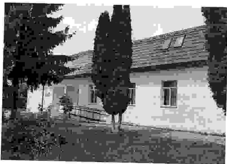
mecanic prestări servicii.